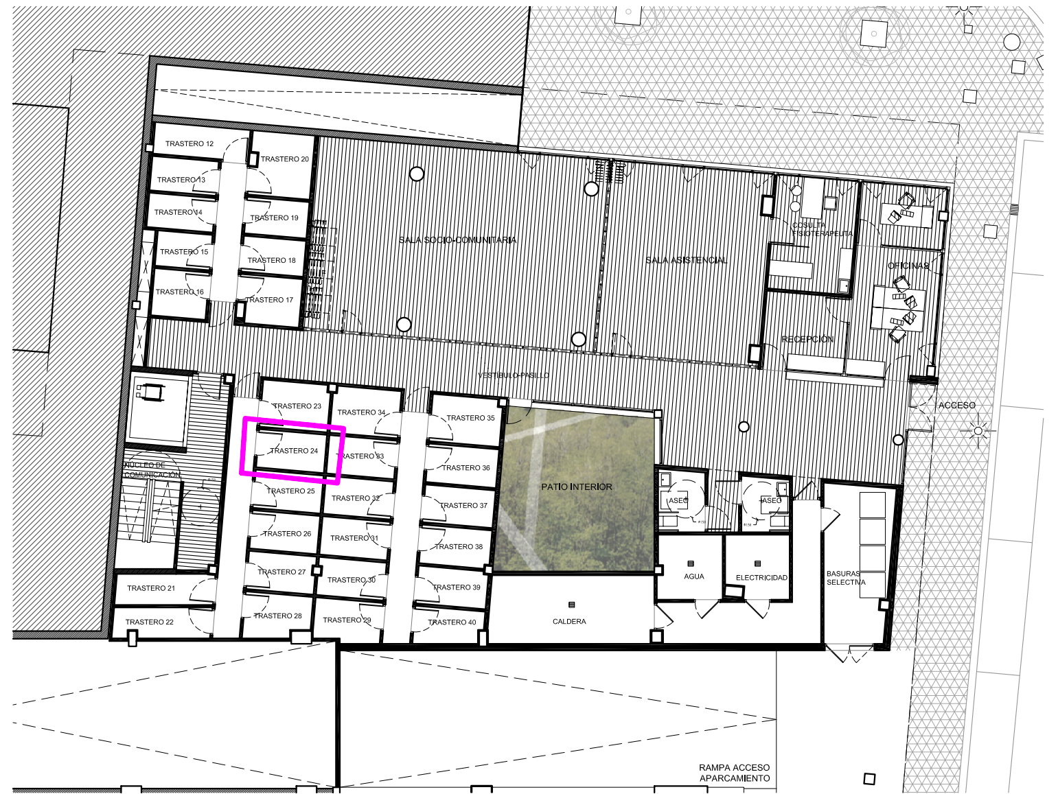
planta semisótano cota 10.35 e_1:200